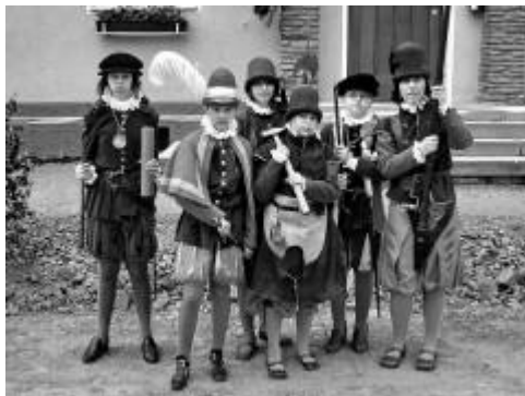
7.6.2007 WALDKIRCHEN - také slavnost Božího těla v rakouském Waldkirchenu je již tradiční akcí, které se zúčastňujeme...