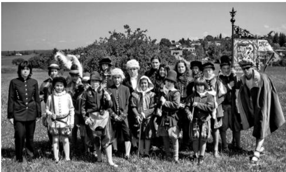
11.6.2007 - Setkání hornických měst v Rudolfově - oblíbený výlet dětí na slavnost, spojený s noclehem v tělocvičně...