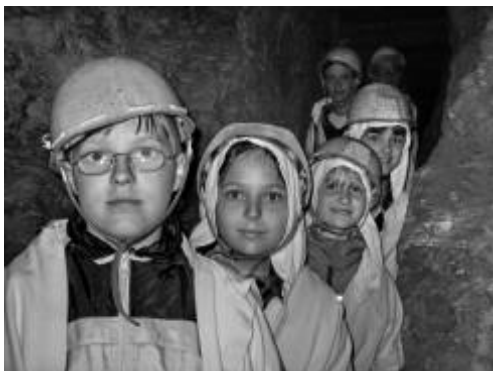
5.5.2007 Výlet do Kutné Hory a středověké vesničky OSTRÉ Dlouho plánovaný výlet do hornického muzea v Kutné Hoře a do středověké vesničky v Ostré se nám konečně podařilo zrealizovat...