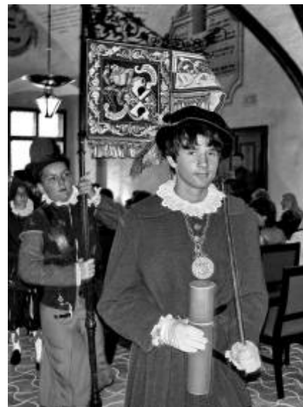
22.6.2007 - Předávání Cen města Jihlavy v gotické síni radnice Těsně před konáním průvodu městem Jihlavou se odehrálo předávání Cen města a Cen rady města Jihlavy. Této ceremonie se také již pravidelně zúčastňuje skupinka havířů z našeho průvodu. Tentokrát byly poprvé veřejně představeny kostýmy horníků, které jsme nechali pro tento ročník ušít pro doprovod dospělých.